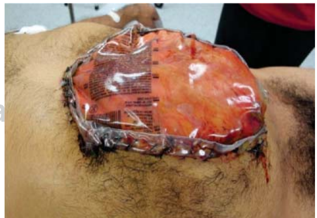
Figura 2. Bolsa de Borráez colocada posteriormente al evento quirúrgico por persistir con hematoma.